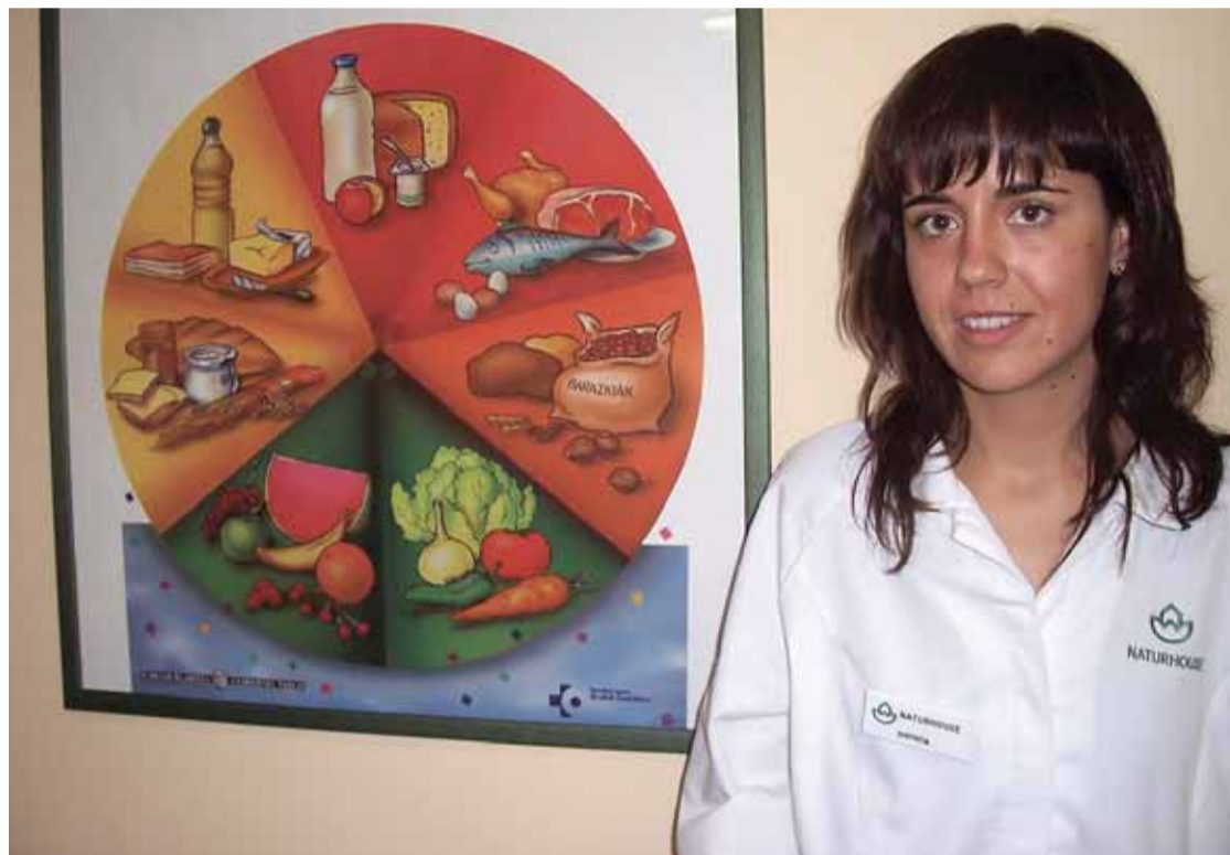
Amaia Camposen ustez, "hobe da frijituak saihestea, baita elikagaien koipe kantitateak handitzen duten teknikak ere".

Dena den, etengabeko ikerketen ondorioz, ideia konkretu